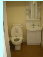
トイレ (ウォレット付) 洗面