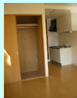
クローゼット 押し入れ