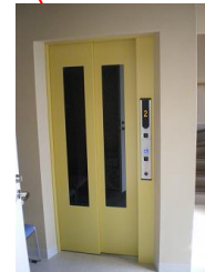
エレベーターは 24 時間ご利用頂けます