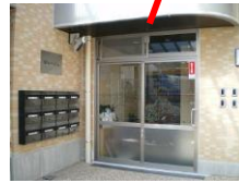
総合エントランス