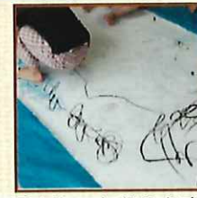
巨大シートおえかき