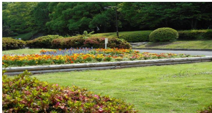
久良岐公園(歩行訓練に利用)

朝のお茶入れ・外のお掃除・庭木の手入れ お昼のお味噌汁の具材の買物を近くの商店街までスタッフとお出掛け・お米研ぎ 機能訓練の為の外出歩行訓練・調理・配膳