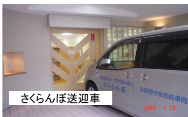
さくらんぼ送迎車