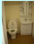
トイレ (ウォレット付) 洗面