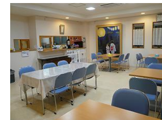
1F 食堂 (サロン夢心) * 昼食を 1F 併設の サロン夢心にて 召し上がることが 出来ます。