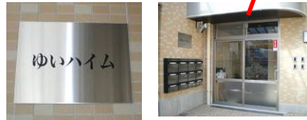
総合エントランス