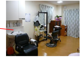
美容室夢心 * 予約制となっております。