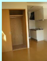
クローゼット 押し入れ