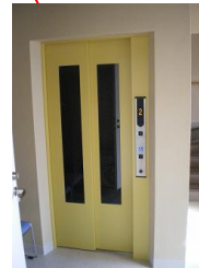
エレベーターは 24 時間ご利用頂けます。