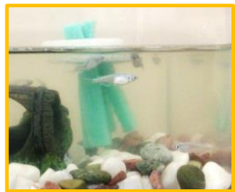
←めだかの飼育を ついでにします

デイサービスのご見学は、いつでも受付けております。お気軽にお問合せください。居宅介護支援センターが併設しているので、介護相談、ケアプラン作成も行っています。