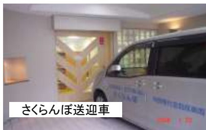
さくらんぼ送迎車