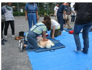
堀睦地区（睦町公園） 蒔田地区（蒔田公園）