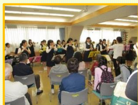
共進中学校吹奏楽部演奏

11月11日（日）晴天に恵まれ、多くの方にお越しいただき、ありがとうございました。ボランティアでご協力してくださった皆様、近隣にお住まいの皆様、心から御礼申し上げます。