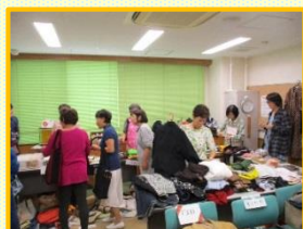
わいわい食堂フリーマーケット