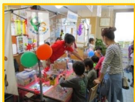
コイイチ工作コーナー